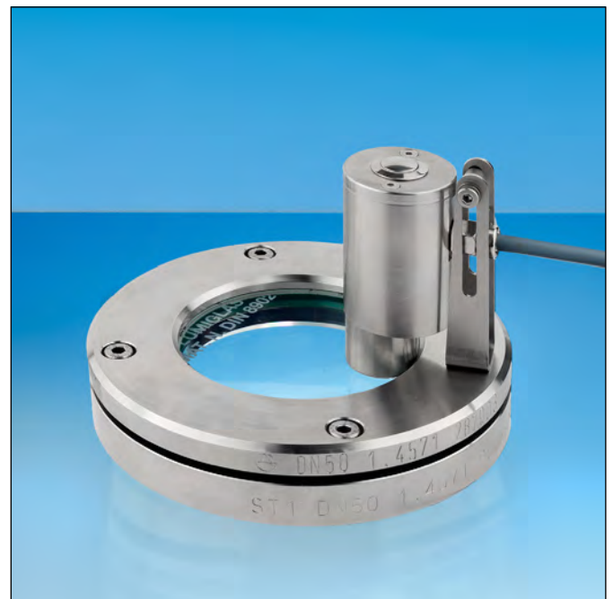
Lumistar luminaire ESL 51-LED-KS monté sur hublot à brides