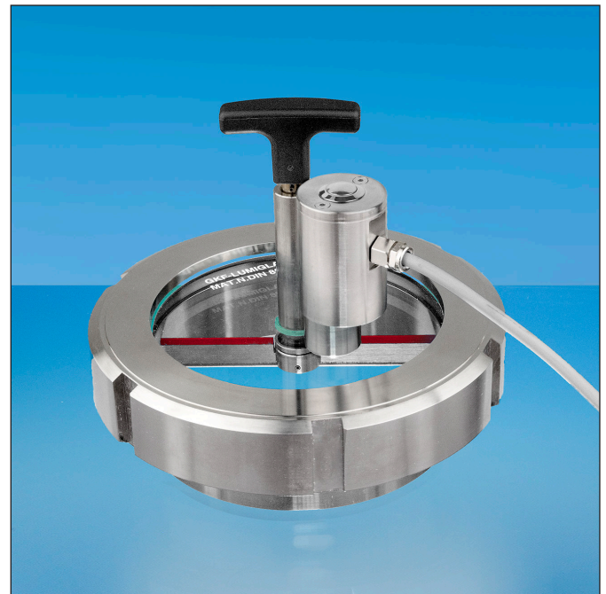
Lumistar luminaire ESL 51-LED-HK installed on a screwed sight glass fitting equipped with Lumiglas wiper unit SW I