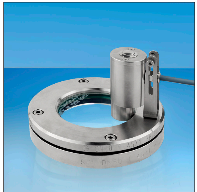
Lumistar luminaire ESL 51-LED-KS adapted to a standard flange